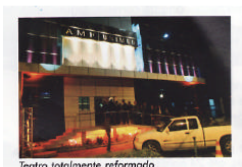
Teatro totalmente reformado

E por falar no espaço cultural, a sua construção foi possível, graças ao apoio financeiro de duas entidades que, segundo o presidente da AMF, têm sido parceiras de todas as horas nessas realizações. Tanto que, para elas, foram destinados espaços dentro da estrutura da nova sede da associação. A Unimed Leste Fluminense montará sua loja onde anteriormente estava o antigo salão de festas e a Unicred funcionará no segundo piso.