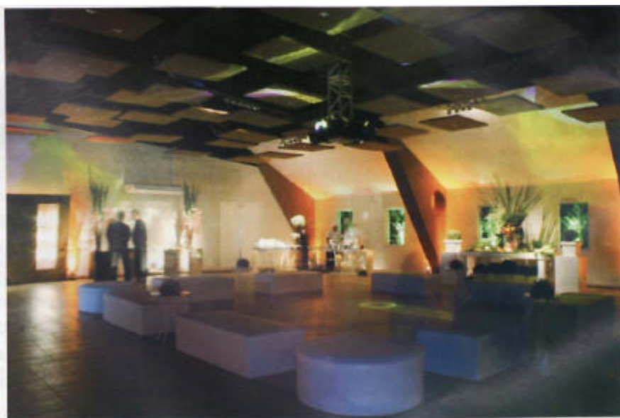
O excelente e multifuncional salão de festas, já funcionando